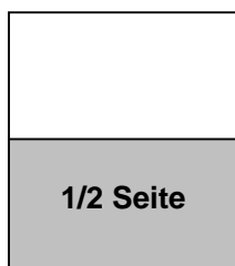
B: 230mm x H: 160mm