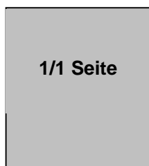
B: 230mm x H: 325mm